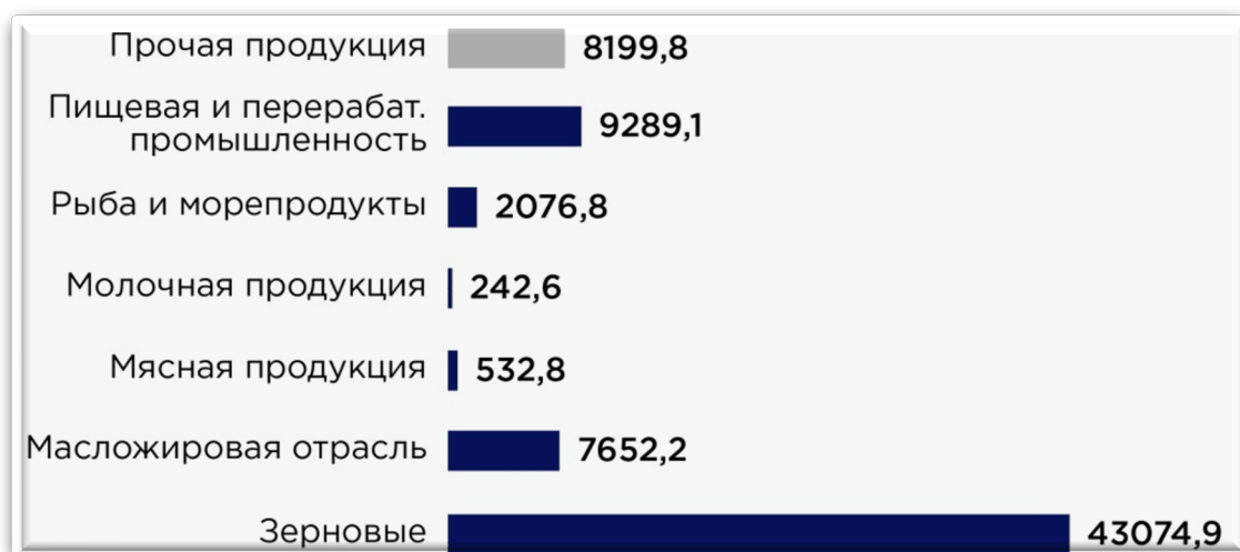
Рис. 1. Экспорт АПК РФ по отраслям на 01.01.2022, тыс.т.

Задание 23. Произвести анализ российского экспорта продукции отраслей АПК (табл.1) Таблица 1 – Положения российского экспорта отдельных товаров АПК в мировой торговле в 2021 году