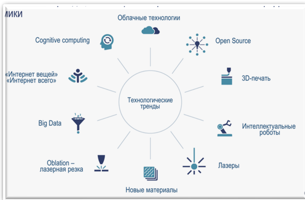
Рим. 1. Блоки цифровой экономики

Задание 28. Согласно рис. 2 «Блоки цифровой экономики», подобрать каждому элементу цифровой экономики соответствующие определение приведенное ниже.