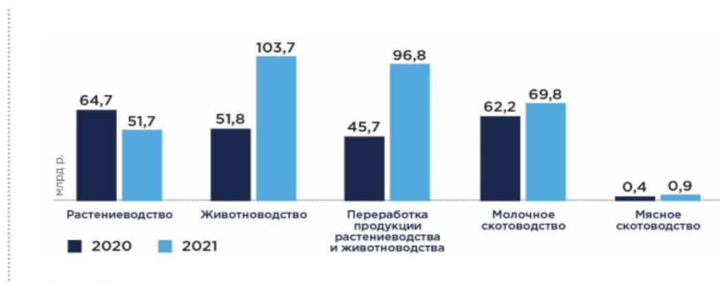
Рис.7. Сумма льготных инвестиционных кредитных договоров, млрд. руб.

Задание 4. Согласно рис. 1 в 2021 году российские аграрии стали кредитоваться наиболее активно по сравнению с предыдущим годом. Данная тенденция наблюдается и в первом полугодии 2022 года.