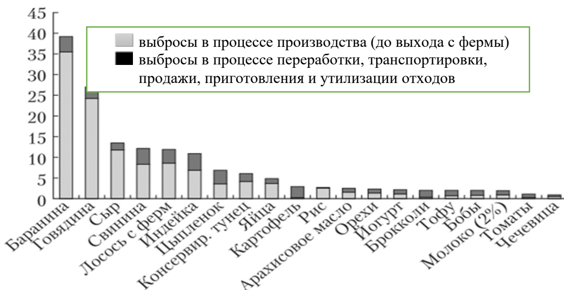
Рис. 1. Выбросы условного CO 2 , кг, в расчете на 1 кг различных пищевых продуктов

Задание 30. В 2021 года в России вступил в силу закон об ограничении выбросов парниковых газов. Закон включает два крупных блока (рис. 3).