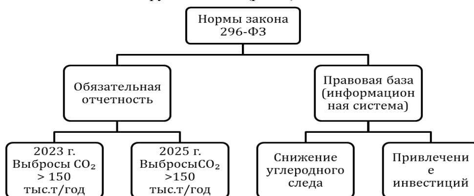
Рис. 2. Положения закона «Об ограничении выбросов парниковых газов» РФ

Задание 30. В 2021 года в России вступил в силу закон об ограничении выбросов парниковых газов. Закон включает два крупных блока (рис. 3).