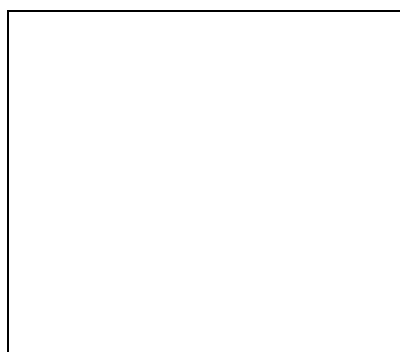
б) после Т.О.