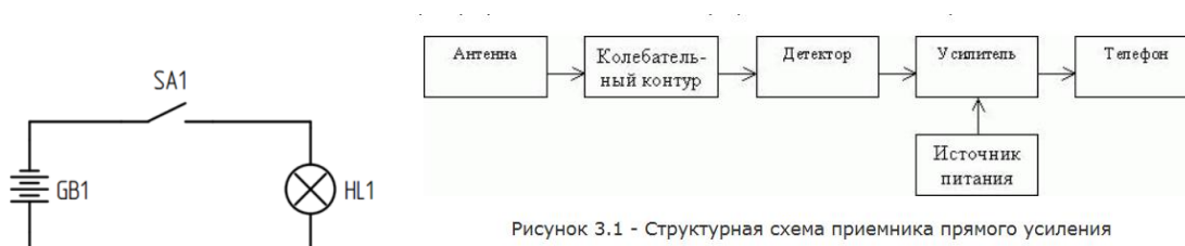
Рисунок 3.1 - Структурная схема приемника прямого усиления

Задача 3. Создать, используя только возможности офисных приложений, одну из схем: